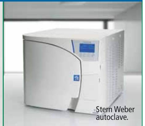
Stern Weber autoclave.