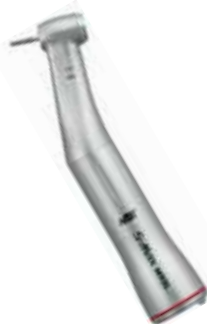
Rødt vinkelstykke fra NSK i rustfritt stål

Årvollskogen 51, 1529 Moss Tlf: 69 23 55 66 - Fax: 69 23 55 65 E-post: post@dentalcare.no