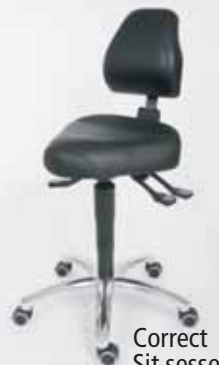
Correct Sit sessel