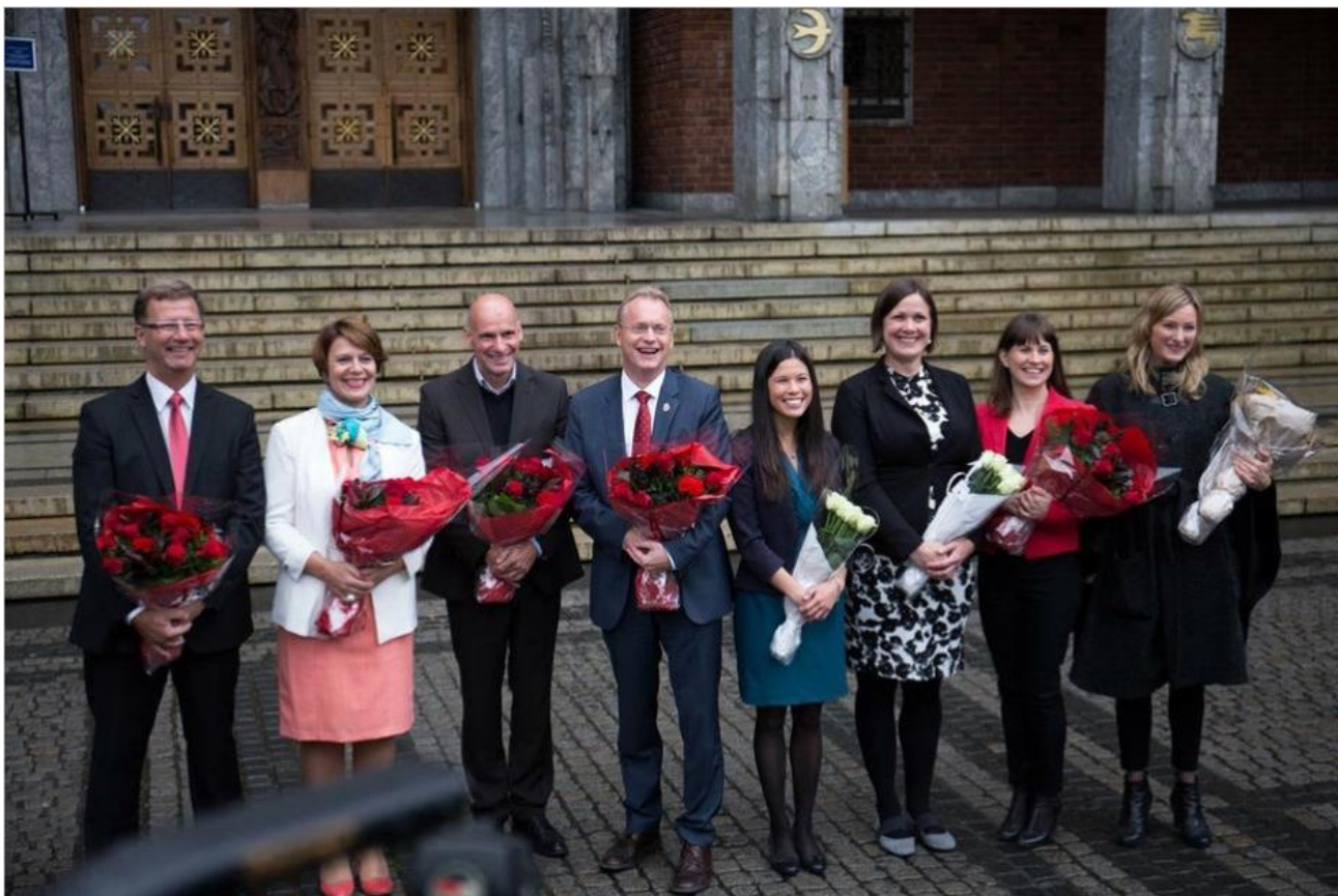
Oslo kommune: Byrådet 2017